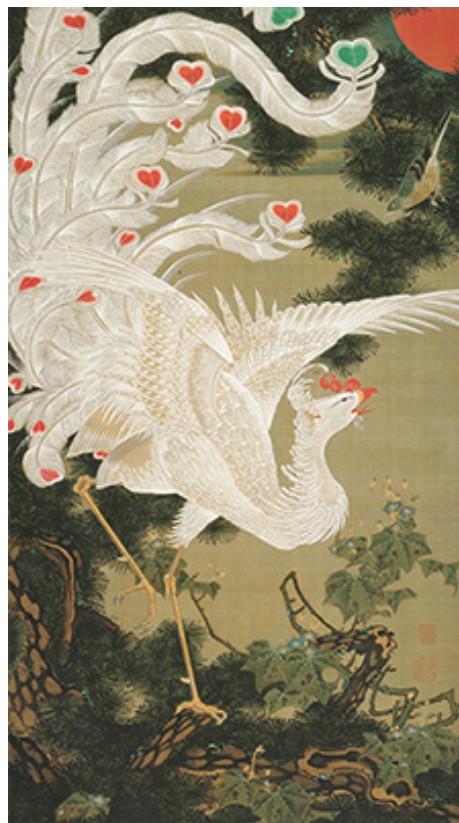
伊藤若冲筆 動植綵絵 老松白鳳図 絹本着色 141.8×79.7cm(宮内庁三の丸尚蔵館蔵)

《動植綵絵》について大典は賞賛し、文化人の売茶翁(1675～1763)は宝暦10年(1760)の冬至の日に見て「丹青活手妙通神」(絵画の見事さは神に通じている)という賞賛の「一行書」を若冲に贈った。若冲も嬉しかったのであろう。《動植綵絵》のうち3