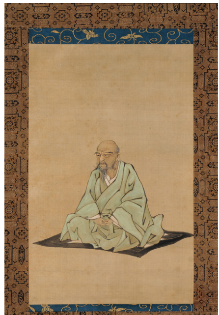
久保田米億筆 伊藤若冲像 絹本着色 55.0×34.9cm(相国寺蔵)

名は汝鈞、字を景和、号は若冲。斗米庵、米斗翁とも称す。名を初め春教と記す文書もある。18世紀の江戸時代中期に京で活躍した画家で、当時から有名だったことは、京の著名人を掲載した人名録『平安人物志』の明和5年版(1768)では大西酔月、円山応挙に次いで3番目(若冲53歳)に「藤 汝鈞 字和号若冲 高倉錦小路上ル町 若冲」と掲載され、安永4年版(1775)・天明2年版(1782)では円山応挙に次いで2番(若冲60歳・67歳)と画家の部上位に登場することから明らかである。