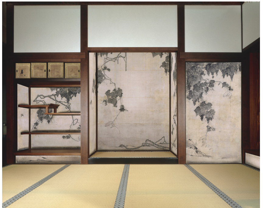
伊藤若冲筆 鹿苑寺大書院障壁画 葡萄小窓図床貼付 紙本墨画 171.0×93.0cm(鹿苑寺蔵) (相国寺ホームページ URL : http://www.shokoku-ji.jp )

絵一枚を米一斗の値で売る生活を送り、一斗六匁で客の要望に応じて作品を制作し、その代金で石峰寺裏山の石像を石工に依頼していたようだ。米斗翁と称したのはこの頃である。そして最晩年の寛政10年(1798)石峰寺観音堂の格天井に花卉図を制作したと考えられている(現在は信行寺に168面、義仲寺に15面が現存)。