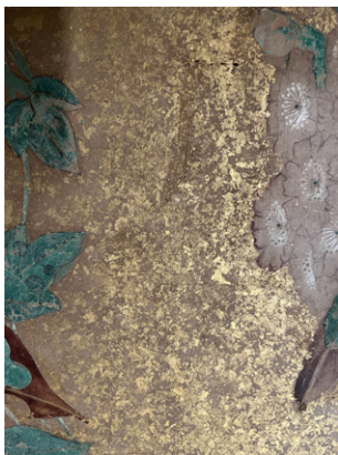
百花図金砂子部分

小豆島の馬越家に生れ、馬嶺、青崖の號があった。高松の中川家の養子となり、高松で有力な画家であった長町竹石(1757~1806)に画を学んだ。後、一家を成し、また子の愛山、馬石、さらに愛山の子の愛竹、愛梅をはじめ門人も多く輩出し高松で有力な画派を形成した 2 。