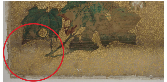
特記写真3 本紙と補紙に砂子が蒔かれている(百花の図右から3) 若松図・百花図修理報告書(株式会社岡墨光堂)

此度《百花図》修理(2021~2023)を行った岡墨光堂の調査により、本紙欠失箇所には過去の修理で裏面より充てられた補修紙に本紙を跨いで砂子が撒かれていたことが判明した。修理の際に砂子が施されており、《百花図》は少なくとも2回以上金砂子が撒かれたことになる。