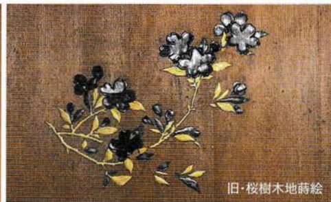
旧・桜樹木地蔭絵