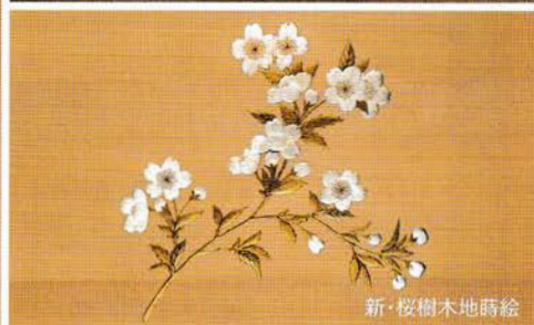
新・桜樹木地蔭絵