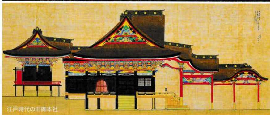
江戸時代の旧御本社

【会 期】 令和6年7月20日(土)～9月30日(月) 会期中無休(臨時休館の場合あり)