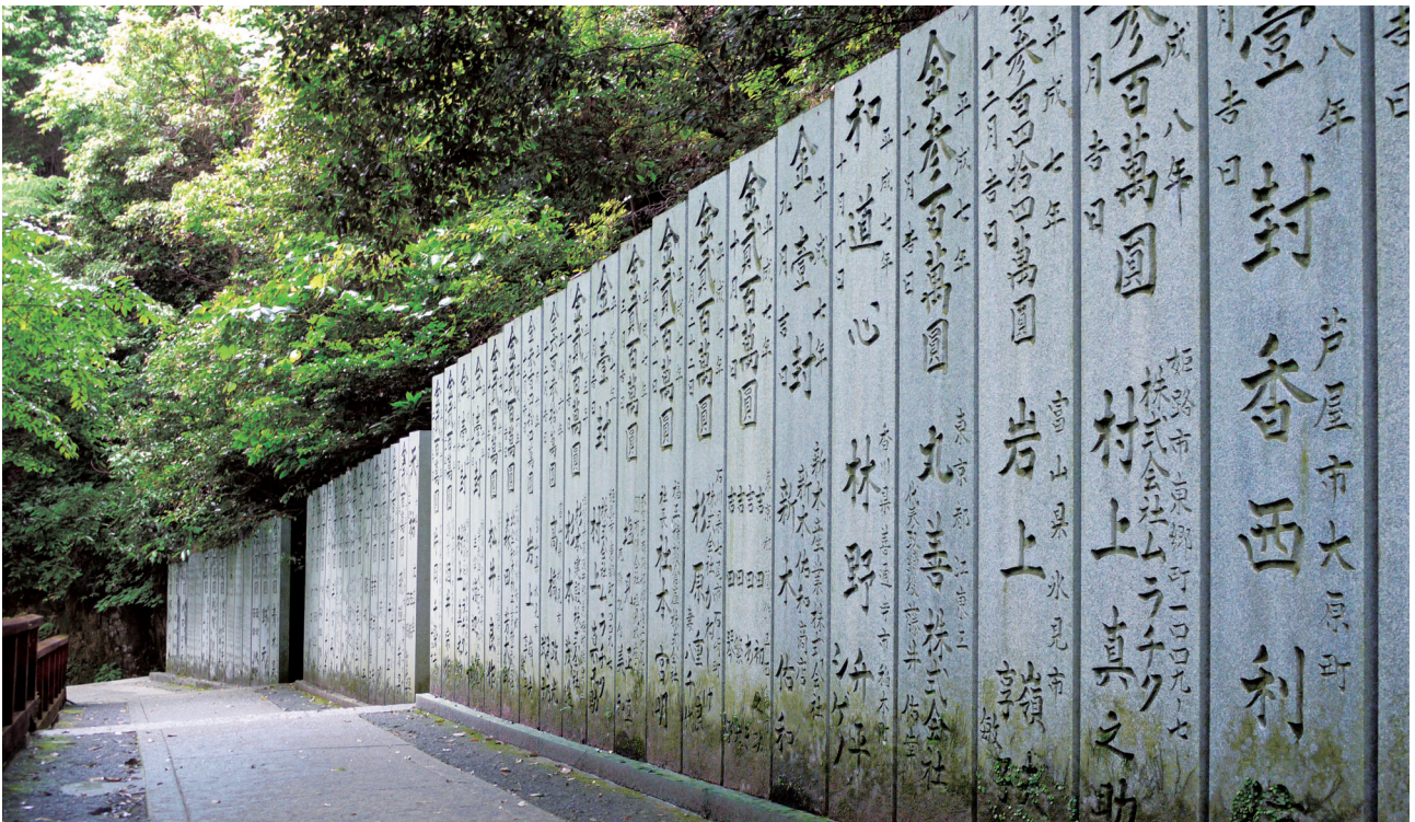
献石建立イメージ図