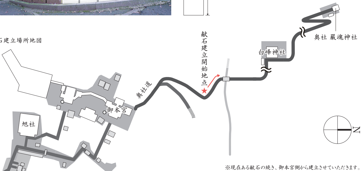
献石建立場所地図

御本宮の向かって右側、展望台から奥社 嚴魂神社へ続く参道（奥社道）には、過去、御寄進いただきました献石が今尚立ち並び、ご参拝者の皆さまをお迎えしております。この度の「旭社 令和の大改修プロジェクト 御奉賛」につきましても、金三百万円以上御奉賛いただいた方には、ご希望により献石の設置を予定しております。